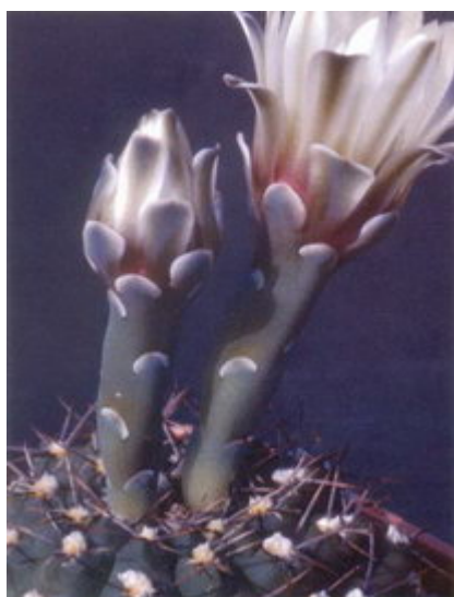
Figure 10 : Gymnocalycium albiareolatum , une jolie espèce, autrefois associée à G. kieslingii

G. albiareolatum (Fig. 10) (décrit en 1985 dans Succulenta par Rausch comme G. alboareolatum , et récemment corrigé). La même année, Ferrari (dans le journal de la US Society) a décrit G. kieslingii avec deux formes : fa. castaneum et fa. alboareolatum .